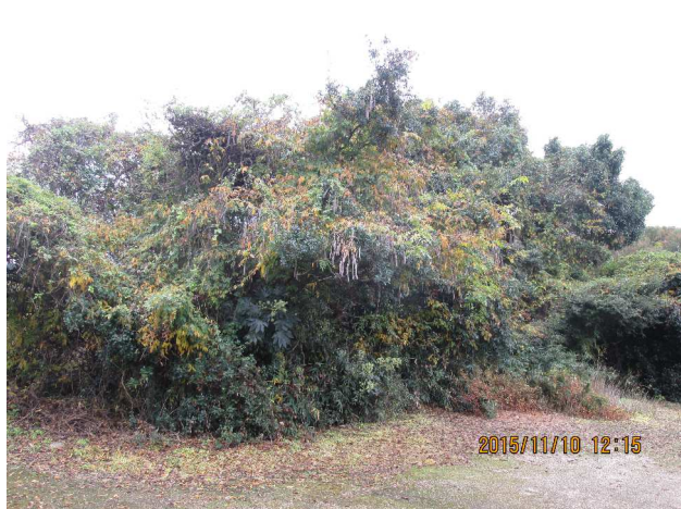
阿知村桜田の古宮跡

当社旧跡同所の内字ナ桜田といふ地にありて、古宮と云伝へたり。天兒屋根命は太古に朱桜を用ひ給ひし事、記紀に見えたれば、旧社地桜田は大に縁故ある所なりけり」とある。