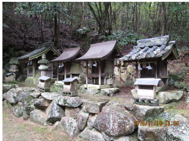
春日神社末社 阿知神社